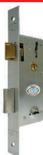
CERRADURA 901 ZINCADA 1 PERNO (TP200)