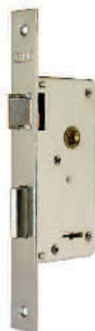
CERRADURA Nº 208 FRENTE ANCHO