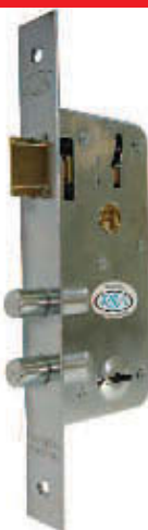
CERRADURA 1001 ZINCADA 2 PERNOS (TP205)