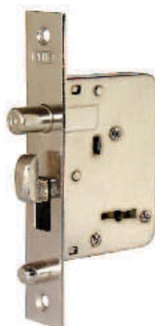
CERRADURA Nº 215 PARA PUERTA BLINDADA