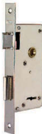
CERRADURA Nº 207 FRENTE ANGOSTO