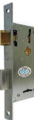
CERRADURA 902 ZINCADA 1 PERNO (TP207)