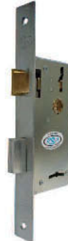
CERRADURA 903 ZINCADA 1 PERNO (TP208)