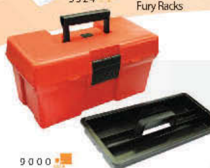
9000 Caja de herramientas 16"