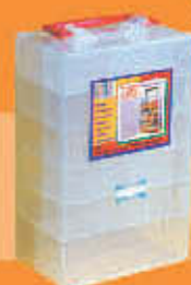
30.600 Organizador doble faz