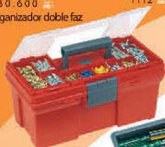
9101 Caja de herramientas 16" con organizador