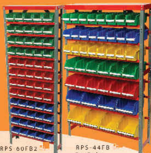
RPS-60FB2 Fury Racks