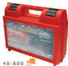
40-800 Caja p/taladro con organizador