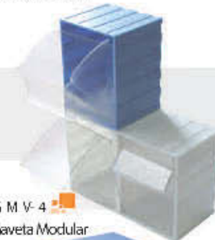
GMV-4 Gaveta Modular