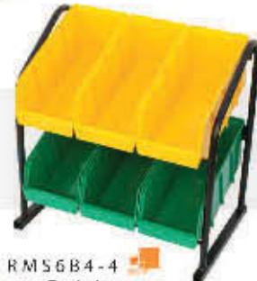
RM56B4-4 Rack de mesa