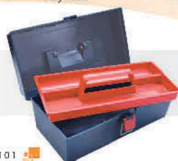
8101 Caja de herramientas 12 7/8"