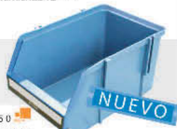
FBM-250 Gaveta modular