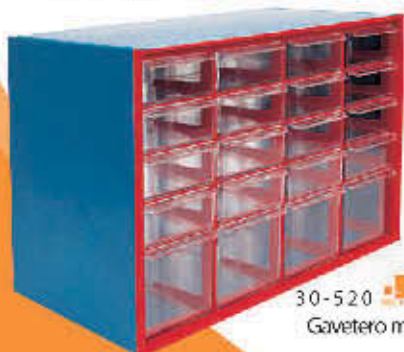
30-520 Gavetero multiuso