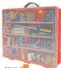
5518 Maletín organizador