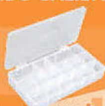
2215 Cajas multiuso